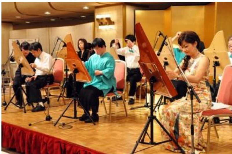
東京都千代田区 日曜青年教室の演奏披露

2009年、行政で初めてヘルマンハーブを7台導入。日曜青年教室の障がい者の自立支援に活用する。2011年にはアンサンブル“ヘルマンハーブちよだ”を結成し、ヘルマンハーブ演奏発表会にも出演。その後2012年、2013年の千代田区賀詞交換会にも招聘され、ご来賓の前で堂々たる演奏を披露し大きな感動を呼んでいます。