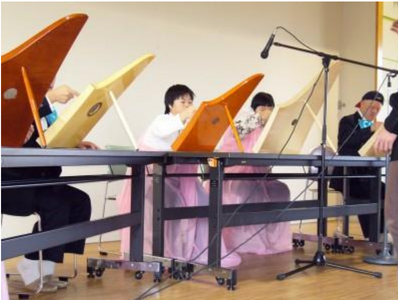
障がい者支援施設 あおばの郷

2008年に障がい者の自立支援の一環でヘルマンハーブを3台導入。その後アンサンブル“こぼと”を結成、ヘルマンハーブの演奏発表会での演奏披露を目標に練習に励んでいます。