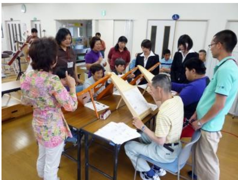
知的障がいのある人の通所施設 デイ雲

丸紅基金を活用され、2010年にヘルマンハーブを3台導入。導入前は自閉症だった男性が今ではヘルマンハーブ同好会のリーダーになってグループをまとめるなど、ヘルマンハーブを導入した効果が目に見える形で表れているそうです。