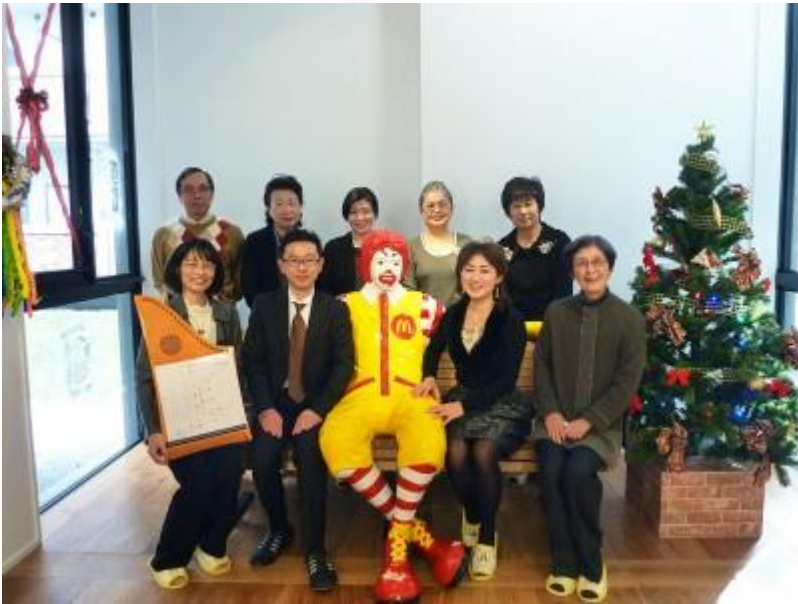
ドナルド・マクドナルド 東大ハウス

シオノギ社会貢献支援会「ソシエ」様の基金を活用して、ドナルド・マクドナルド・ハウス東大様がヘルマンハーブを導入。入院するお子様の親御さんが宿泊する施設で、宿泊される方々の安らぎのひと時に役立っています。